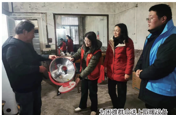
为困难群众送上取暖设备

我市推动水费、天然气费减免扩展到四类低收入人口以及孤儿和事实无人抚养儿童。其中,天然气费减免由每户每年120立方米增加到150立方米。全面实施“暖心护航”智能设备关爱行动,通过安装3000多套(户)智能监测设备,建立