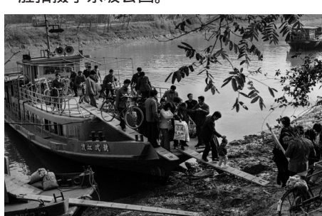
1979年,汤德胜拍摄的作品《渡江英雄》2号船,解放后服役于运河客运航班。