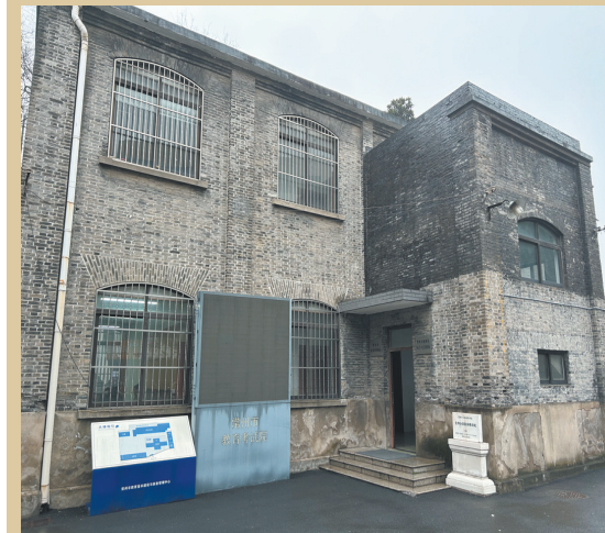
唐驼当年所办的祠校，现在只剩下部分建筑

民国时期，盛宣怀的孙子盛毓度东渡日本，在东京买下一块地皮，创办留园饭店。由于经营得法，获利颇丰。为回报故乡常州，盛家在距离祖宅附近、距离锁桥约200米的地方助建了一所小学——“盛毓度小学”。