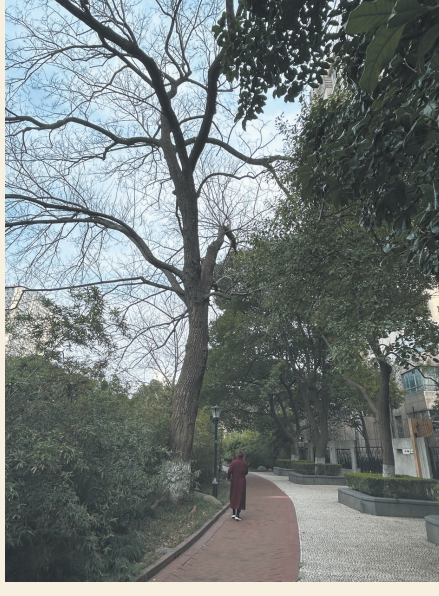
令丁正念念不忘的大槐树