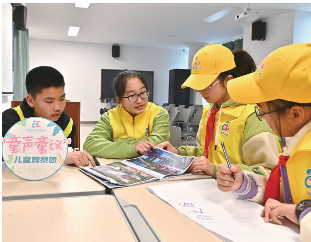
■叶平 秋冰 文

本报讯 “这里，最好建设一个树屋状的图书角。”“口袋公园与儿童医院相连，最好多举办一些科普活动。”23日，常州市“儿童观察团”成员受邀走进市儿童医院和东侧的“沙之谷”口袋公园，短短一个下午，他们一连提了30多条意见与建议。这些“童声童议”，将被融入我市口袋公园等儿童友好工程的建设中。