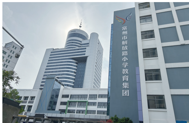
现在的解放路小学