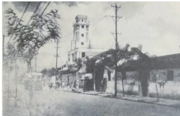
上世纪50、60年代的解放西路

几乎每座城市,都有一条路叫“解放路”,它是新中国成立的印记,也记录着70多年来发展的波澜壮阔和细微点滴。当年,常州也曾有一条叫“解放”的道路,承载了几代人的记忆和情感。