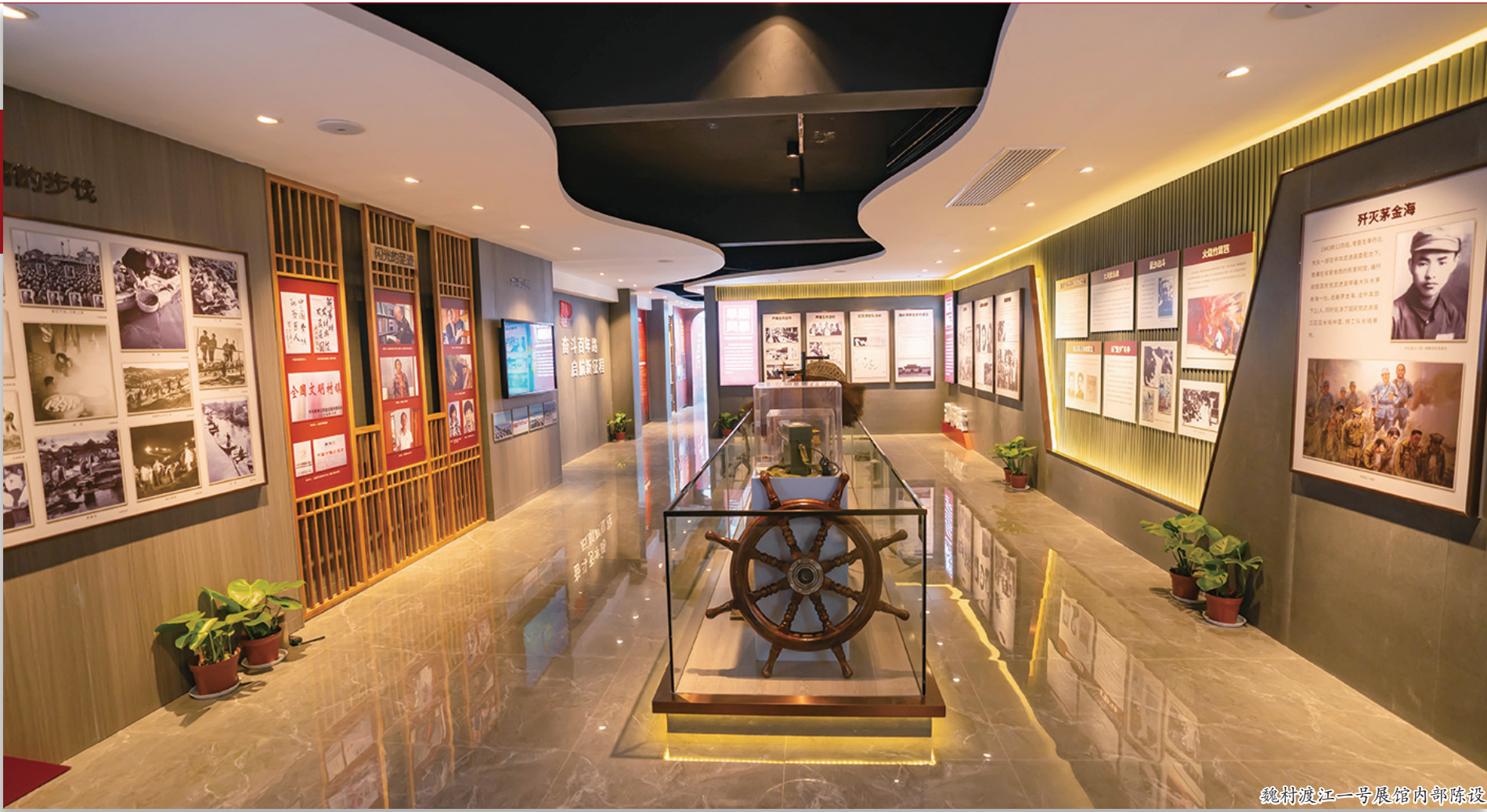
魏村渡江一号展馆内部陈设