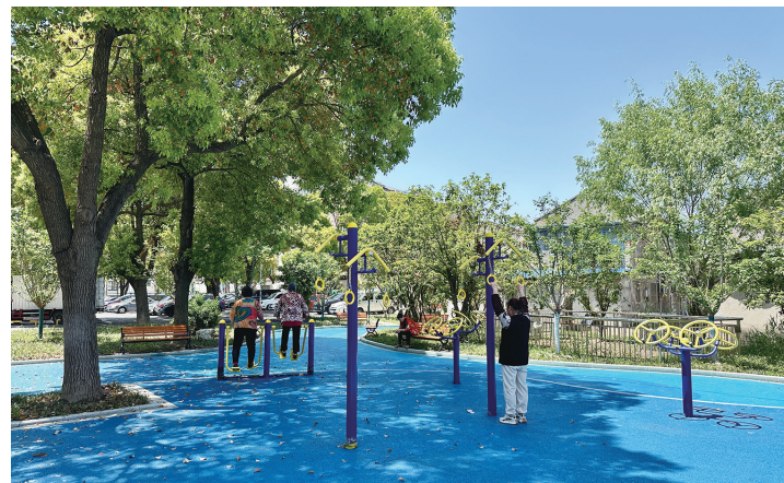
解放村的村民在锻炼身体

进入新时期,解放村大力发展新农村建设。住过城中村的人都知道,最不方便的是上厕所。为解决如厕难问题,近年来,解放村建成10座公厕,24小时免费开放。很多变化悄然发生,村里的文明风气越来越浓。