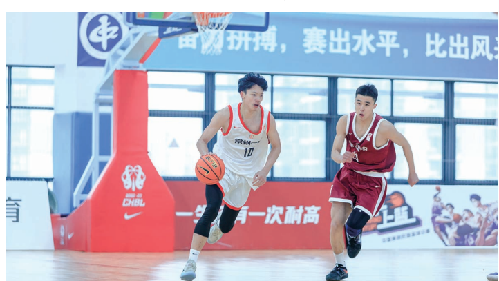
市一中男篮是省内强队,多次夺冠。