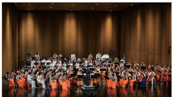
一中民乐团多次在常州大剧院演出