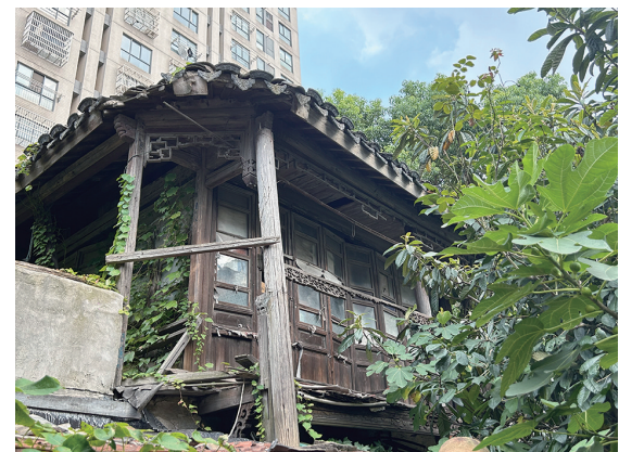
无花果树掩映下的杨氏家庭戏楼

在清末,中秋、春节等重大节日,杨氏家族常会请戏班来家中唱堂会,一家人其乐融融,一边赏月,一边听戏,演员唱的剧目以昆曲和京剧的折子戏为主。