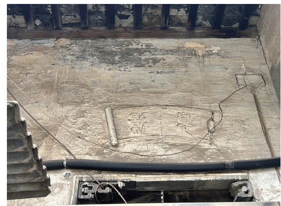
老建筑上写有“息影”两个字

“包括杨家老宅在内,沿着古运河,坐落着一排老房子,很有江南水乡的特色。我年轻时候,经常在运河边淘米。没有自来水的年代,我们就吃运河水。没有运河,就没有那时候的我们。”