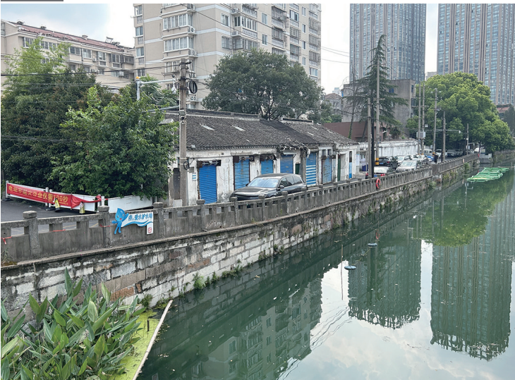
从古运河中新桥上看杨氏宅第