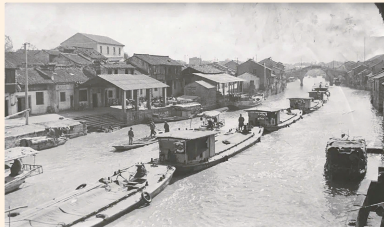
以前，繁忙的表场码头。