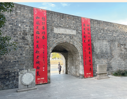
春节期间的西瀛门