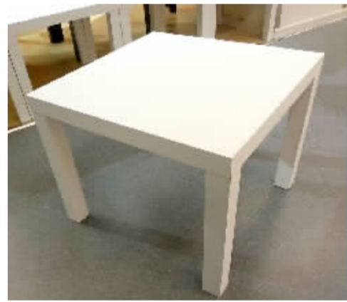
图为湖塘红星美凯龙星艺佳赠送的学科茶几。

6月季“十佳书法少年”大赛颁奖典礼将于7月19日下午在湖塘红星美凯龙举行,欢迎各位学生和家前来观摩。 6月季50名参赛选手将与家长一起,参与现场动手游戏,拼装成功的茶几,将作为礼品赠送给各位选手。