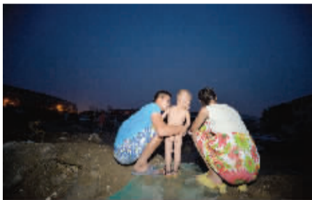
晚上 6 点 30 分,一家三口在工地上乘凉。