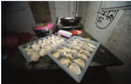
桌上的速冻水饺是白天从超市里买的。